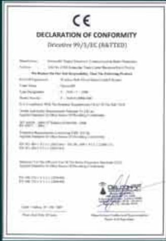
DECLARATION OF CONFORMITY DelcomRF