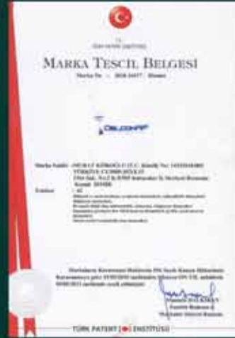
DelcomRF Marka Tescil Belgesi